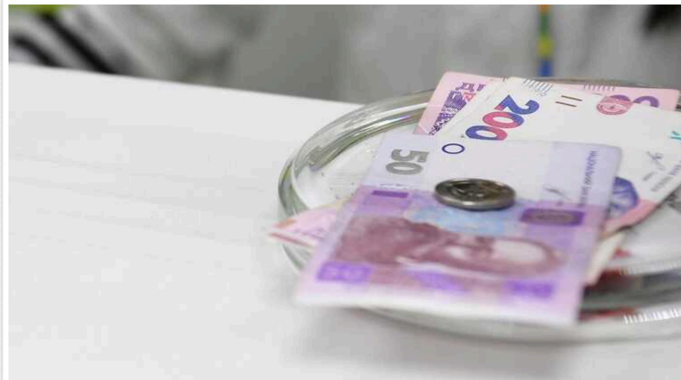
Українці масово забирають гроші з банків: у січні зняли рекордні 27 мільярдів

У січні українці зняли з рахунків 27 млрд. грн. Це рекордне зняття заощаджень після запровадження в Україні військового стану 24 лютого 2022 року.