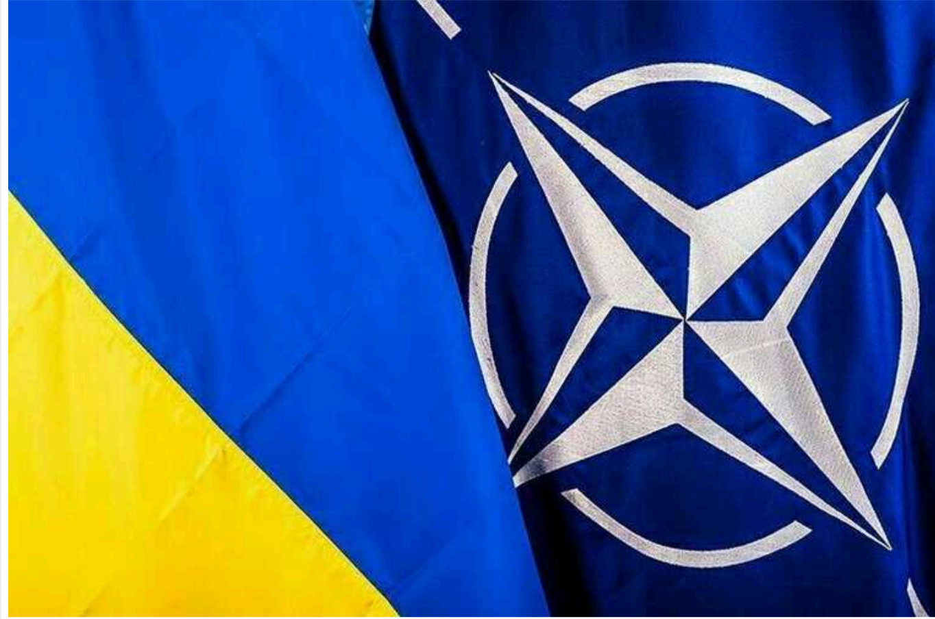
Посол США в НАТО: не очікую, що Україну запросять до Альянсу на саміті

Видання Reuters повідомляє, що пані посол США в НАТО Джуліанна Сміт заявила про те, що Україні не варто очікувати на запрошення до Альянсу на літньому саміті у Вашингтоні.