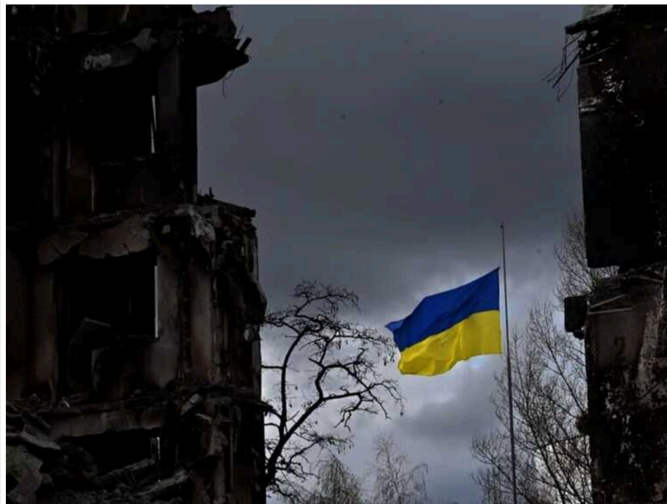
В Україні різко зросла кількість жертв серед цивільного населення, - ООН

За останні два місяці в Україні різко зросла кількість жертв серед цивільного населення.