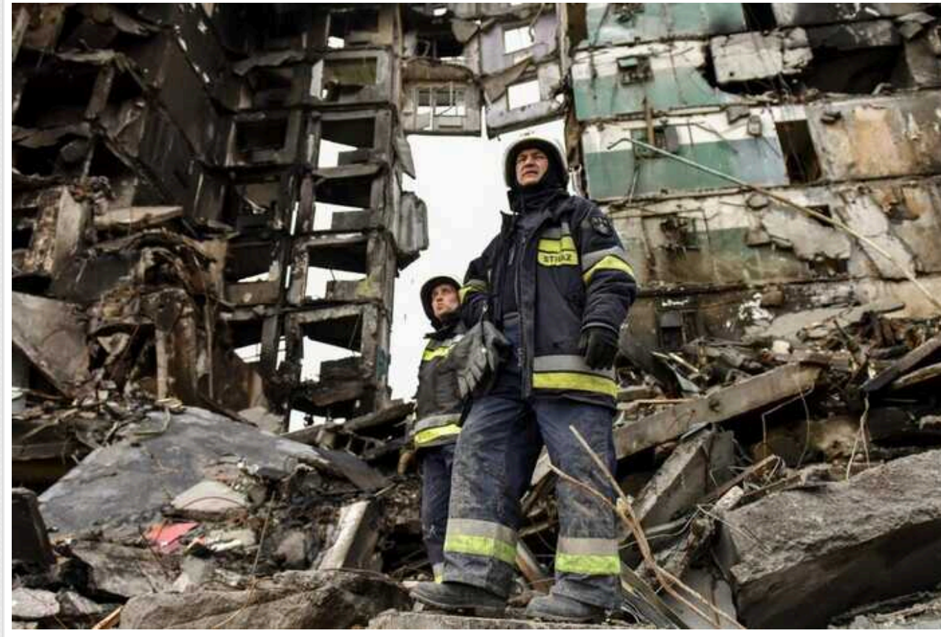
В Україні вже більше місяця видають житлові сертифікати громадянам, які втратили житло під час воєнних дій

Минулого року парламент ухвалив закон, згідно з яким громадяни, які втратили житло під час військових дій, отримуватимуть компенсації не живими грошима, а сертифікатами. І вже за них зможуть купити нову квартиру чи будинок.