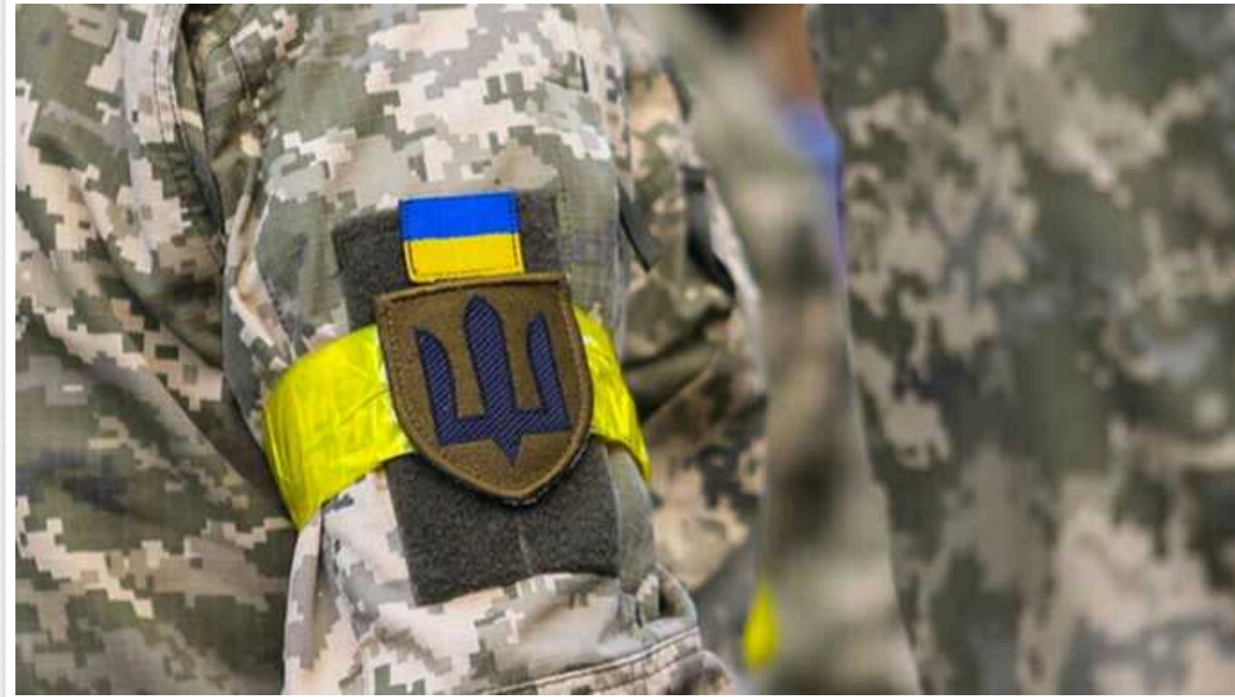
Мобілізація в Україні: В Одесі жінки не дали ТЦК перевірити документи чоловіків у трамваї