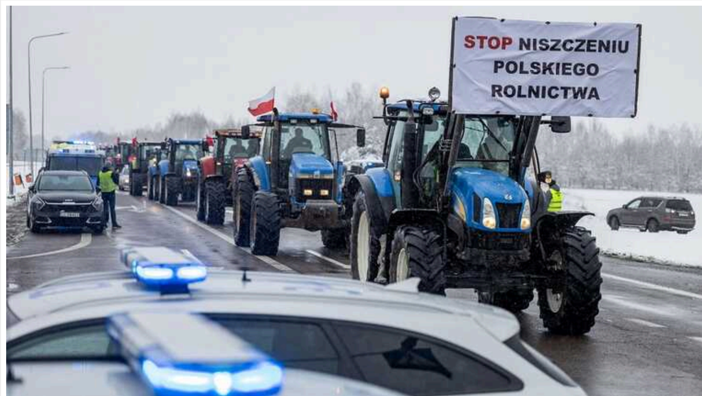
Польські фермери оголосили про старт 30-денного страйку: перекриють усі автомобільні КПП на кордоні з Україною, залізничні вузли та порти

Польська профспілка фермерів «Солідарність» повідомила про старт загального 30-денного страйку фермерів, під час якого буде заблоковано всі вісім автомобільних пунктів пропуску на кордоні з Україною. Починати перекриття всіх КПП вони планують уже 20 лютого.