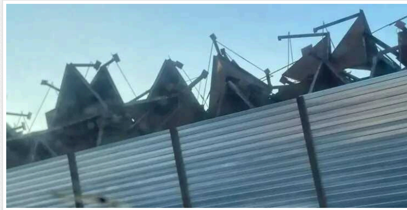
Партизани "Атеш" виявили підпільний завод із виробництва "зубів дракона" в окупованій Євпаторії

За даними підпілля, продукцію, що виготовляється, росіяни передають окупаційним військам, які продовжують будувати фортифікаційні споруди вздовж берегової лінії та адмінкордону з Херсонською областю.