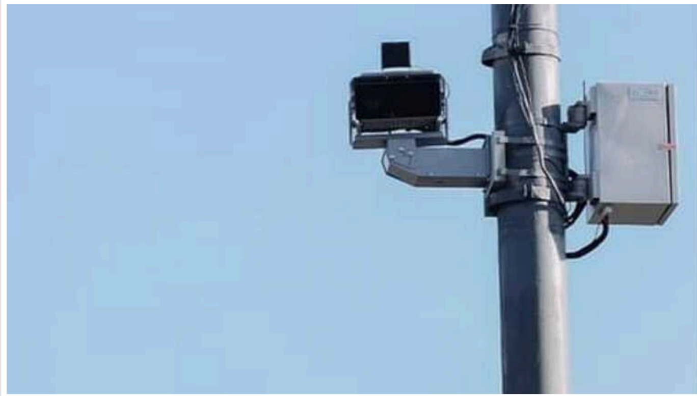
Нічні спалахи від камер на дорогах Київщини: чи демонтують стробоскопи, які засліплюють водіїв

Камери, які є на дорогах Київської області та спалахами сліплять водіїв, встановлені по програмі безпечне місто. Вони необхідні для запобігання злочинів і фіксують обличчя учасників дорожнього руху.