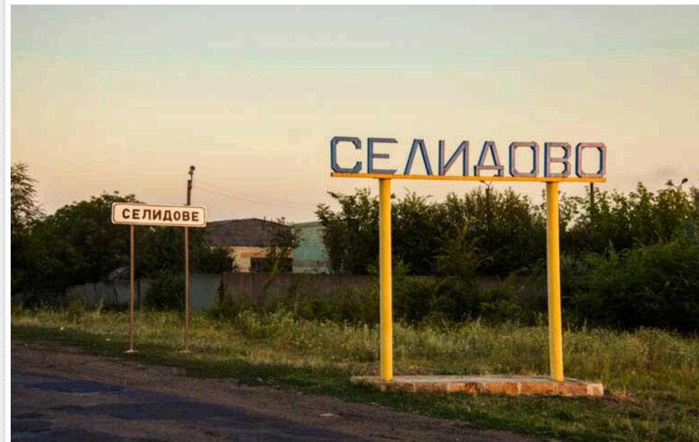
У ЗСУ спростовують інформацію про удар по полігону у Селидовому Донецької області

Російські військові пабліки стверджували, що Україна зазнала внаслідок удару великих втрат в особовому складі - писали про нібито сотні або навіть понад тисячу загиблих.