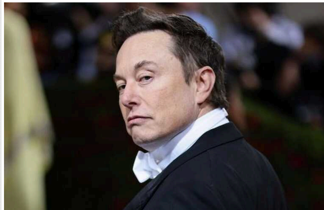
Напередодні голосування за допомогу Україні в Сенаті Ілон Маск закликав американців вплинути на своїх сенаторів, щоб ті провалили законопроект

Про це бізнесмен заявив у бесіді з сенаторами-республіканцями, опублікованій у X (Twitter).