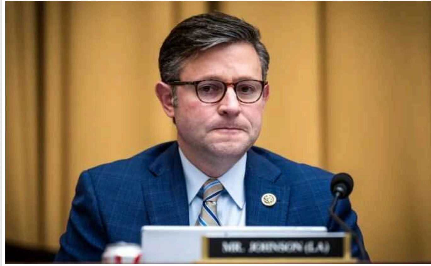
Спікер Палати представників Джонсон заблокує законопроект про надання допомоги Україні, Ізраїлю та Тайваню, – The Hill

Спікер Палати представників Джонсон дав зрозуміти, що заблокує законопроект про надання допомоги Україні, Ізраїлю та Тайваню без рішень щодо кордону, якщо він пройде через Сенат.