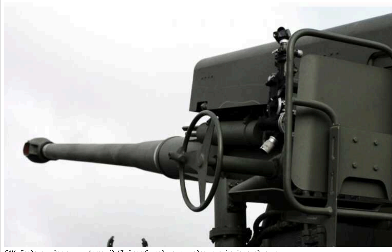
САУ «Богдана» у детальних фото від 47-ої артбригади: як виглядає механізація заряджання

Українські артилеристи зазначили, що САУ «Богдана» має ідеальне співвідношення точності та сили.