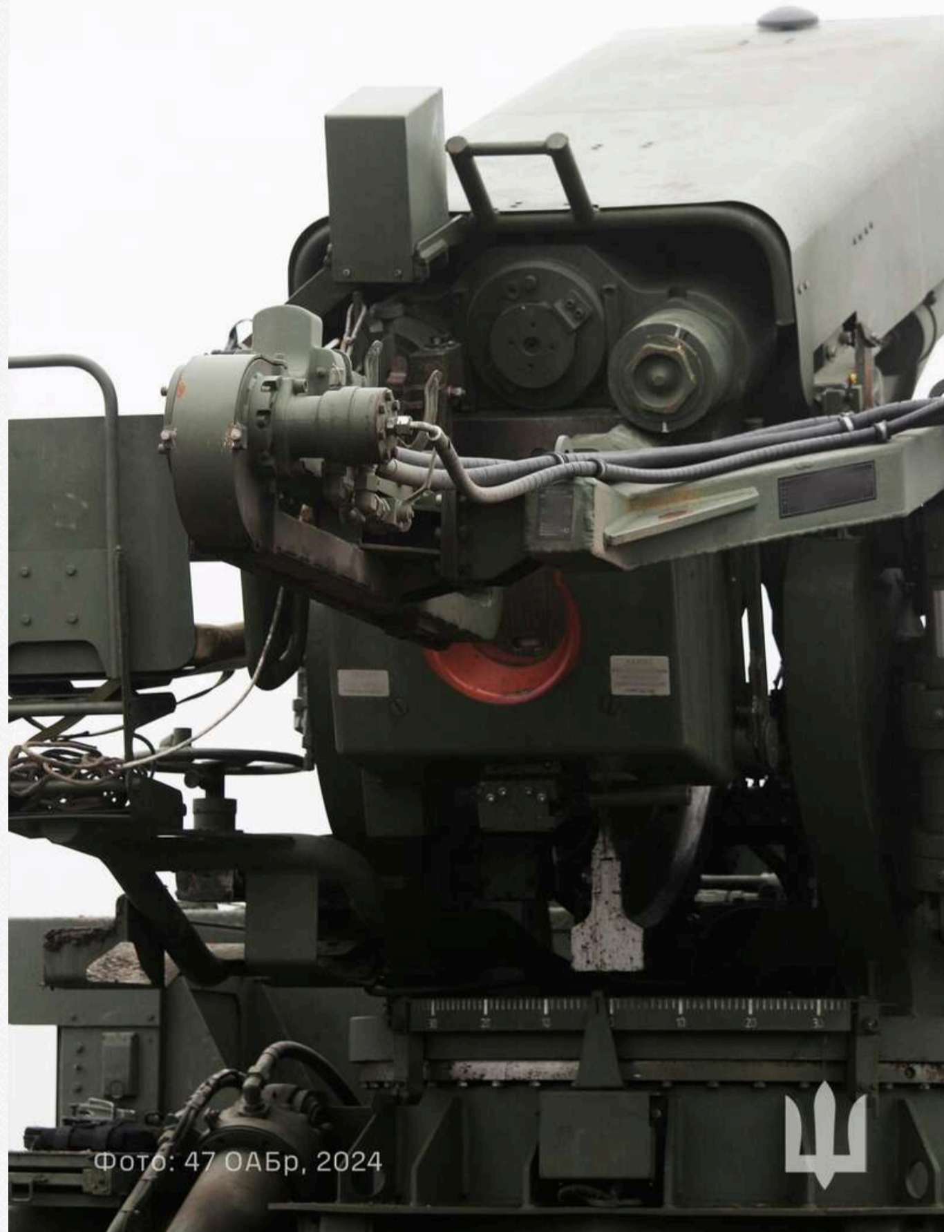
Фото: 47 ОАБр, 2024

На фото чудово видно всю систему з ланцюговим досилачем, який є доволі розповсюдженим в артилерійських системах засобом механізації заряджання. Наприклад, він використовується у САУ Dapa, де є частинною автоматизованого заряджання.