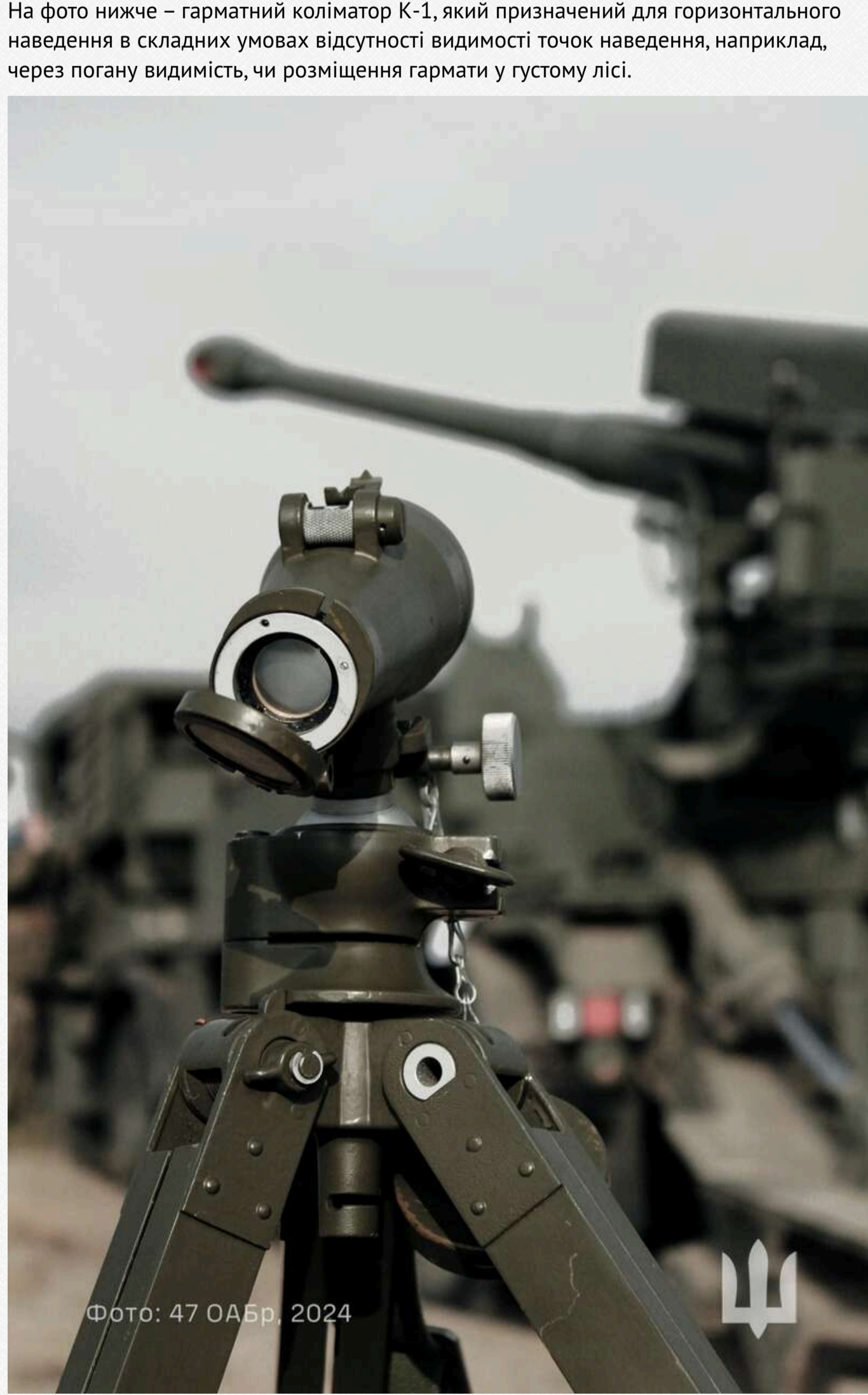
Фото: 47 ОАБр, 2024

У дописі артбригади також вказано, що САУ «Богдана», хоч й потребує постійного догляду, як і будь-яке озброєння, вона має "ідеальне співвідношення точності, сили та бойової атмосфери... якщо згадувати наш досвід роботи з нею, можна ствердити, що вона здатна на будь-що".