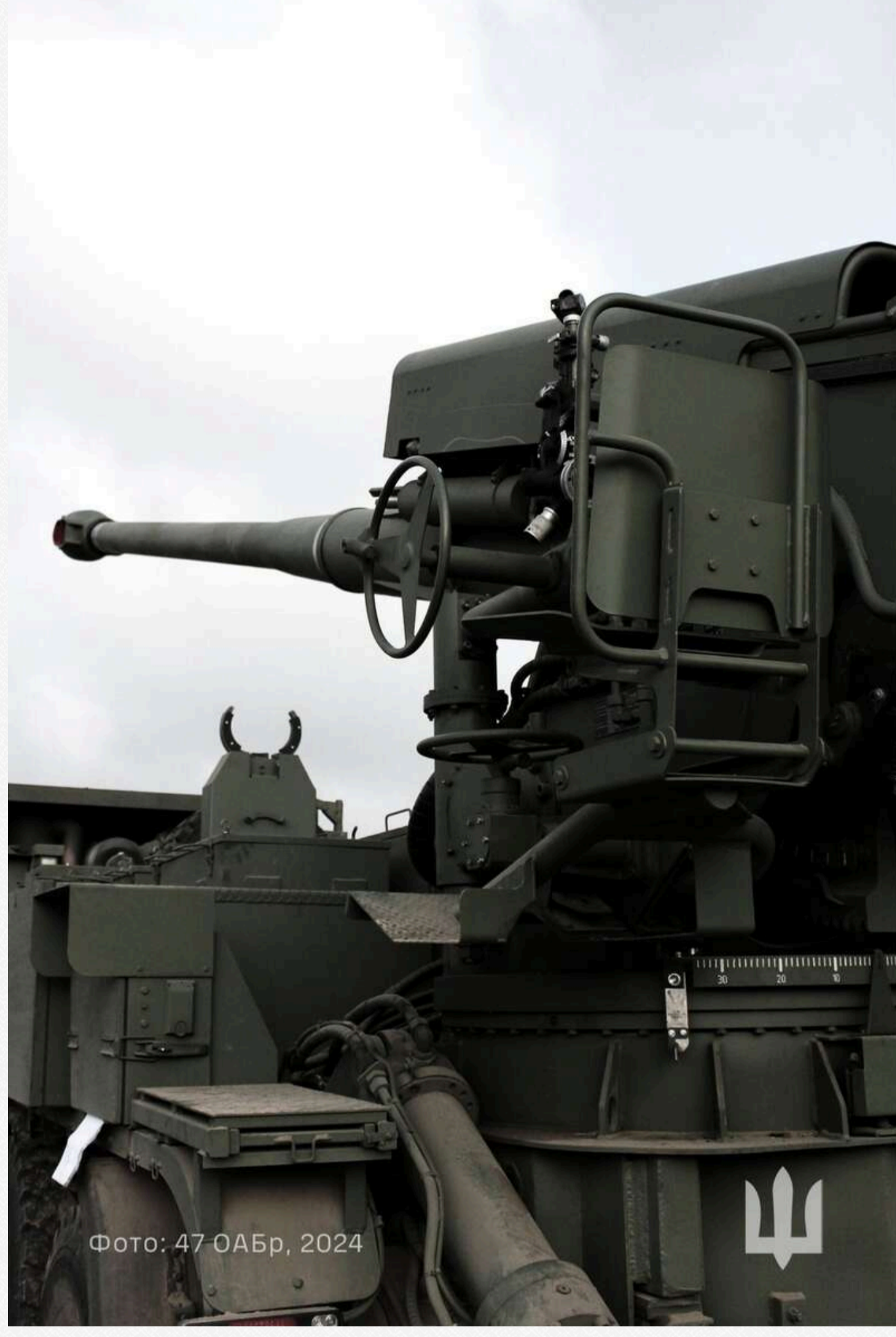
Фото: 47 ОАБр, 2024

Така система для САУ «Богдана» дозволяє спростити операції з 40-кг 155-мм снарядами, які до цього подавались та досилились "руками".