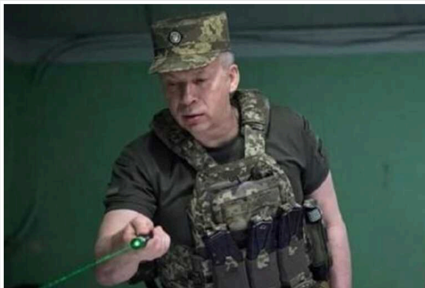
Dream team Сирського? Чого чекати від нових призначень у ЗСУ

Минулими вихідними Президент України Володимир Зеленський, як і анонсував раніше, повністю перезавантажив військове керівництво Збройних Сил України.