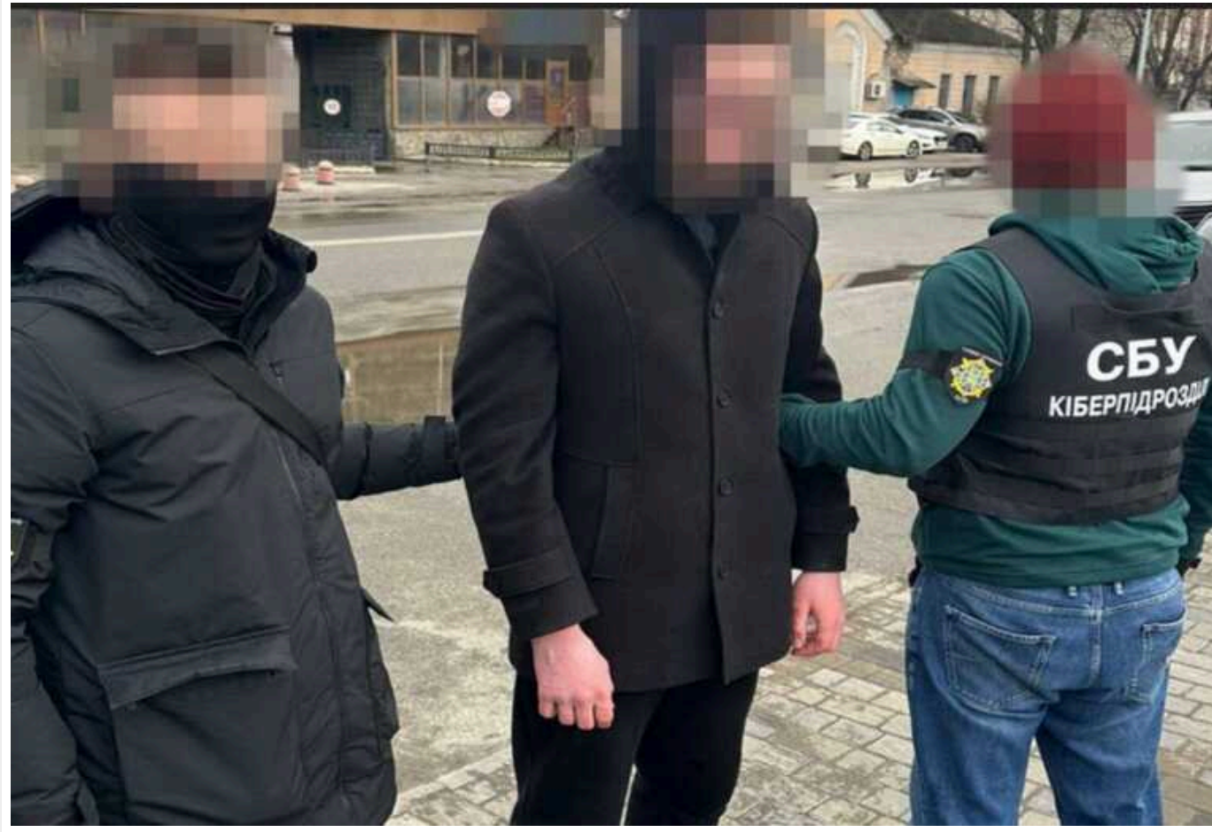
СБУ затримала на Київщині російського агента, який орендував квартиру біля аеродрому, щоб шпигувати за літаками ЗСУ

Кіберфахівці Служби безпеки затримали ще одного агента ФСБ, який збирав розвіддані про Сили оборони та критичну інфраструктуру на Київщині.