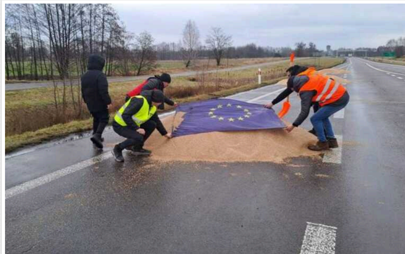
Посол України в Польщі назвав дії фермерів на кордоні варварськими

Посольство і Генеральне консульство України в Любліні звернулось до поліції Польщі із вимогою розслідувати інцидент на кордоні. Як результат – поліція Польщі відкрила провадження щодо розсіпаного польськими фермерами українського зерна біля пункту пропуску «Дорогуस्क – Ягодин».