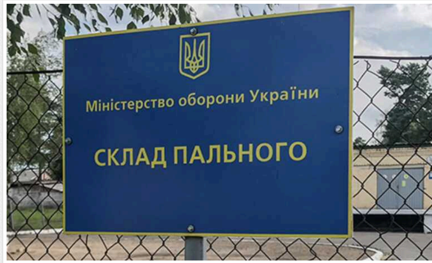
В Одесі сержант повинен відшкодувати 6,3 мільйона гривень за втрату авіапального через недбальство

В Одесі штаб-сержанта 46-го об'єднаного центра забезпечення Віталія Прокопчука засудили через недбалість, що під час війни призвело до втрати 88,7 тонн авіаційного пального.