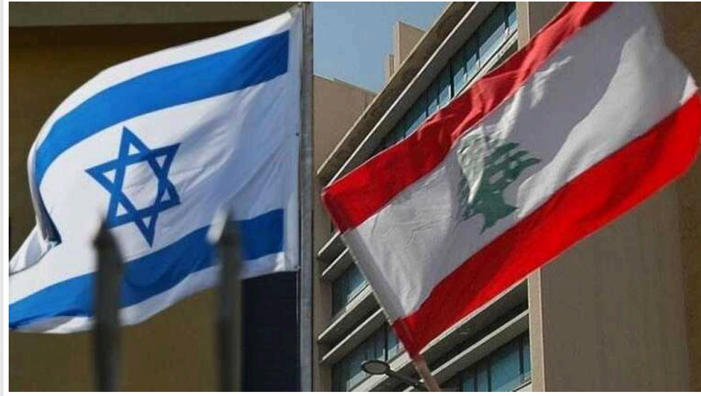
Франція запропонувала план мирного договору між Ліваном та Ізраїлем

Франція направила офіційному Бейруту письмову пропозицію, спрямовану на припинення військових дій і врегулювання протистояння на лівансько-ізраїльському кордоні.