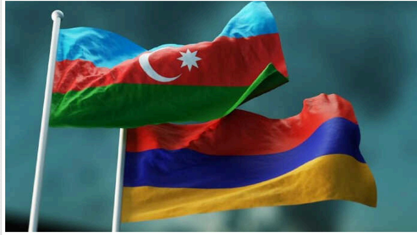
Вірменія та Азербайджан обмінялися звинуваченнями в обстрілах із жертвами та пораненими

Азербайджан та Вірменія обмінялися звинуваченнями в обстрілах на кордоні, внаслідок яких є загиблі та поранені військовослужбовці.