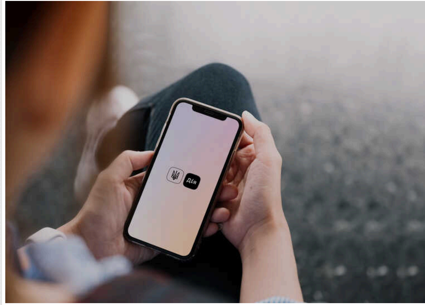
Федоров анонсував вісім нових послуг у «Дії»: розмитнення авто, онлайн-шлюб та інші

Найближчим часом у застосунку "Дія" з'являться вісім нових послуг. Серед них – розмитнення авто, онлайн-шлюб, кабінет пацієнта та інші.