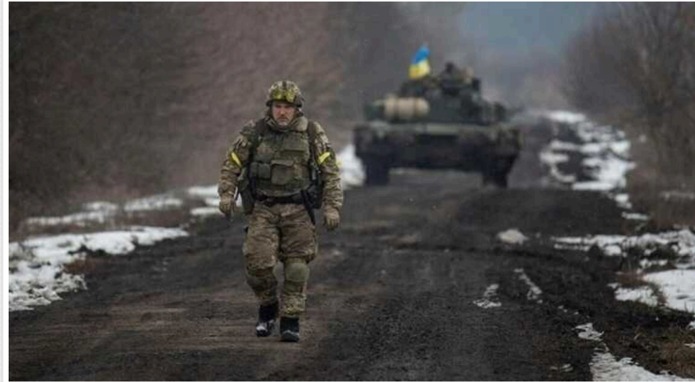
Ситуація на фронті: Протягом доби відбулось 84 бойових зіткнення

Противник і надалі продовжує ігнорувати закони та звичаї ведення війни, використовує тактику терору, завдає ракетних та авіаційних ударів, здійснює обстріли з реактивних систем залпового вогню не тільки по військових, а й по численних цивільних об'єктах нашої держави.