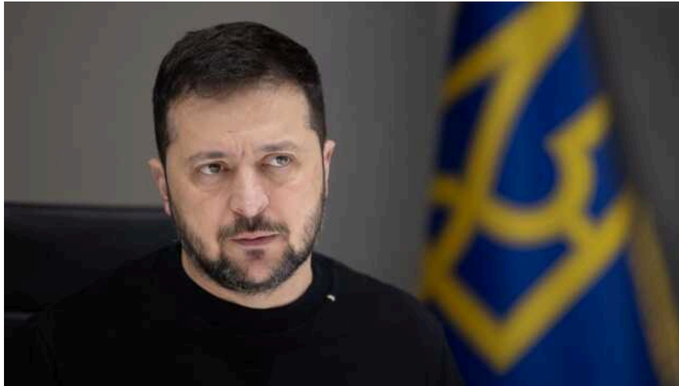
Bloomberg: Зеленський може поїхати в турне столицями Західної Європи

Президент України Володимир Зеленський планує здійснити турне Західною Європою. Зокрема, він хоче відвідати Мюнхенську безпекову конференцію.