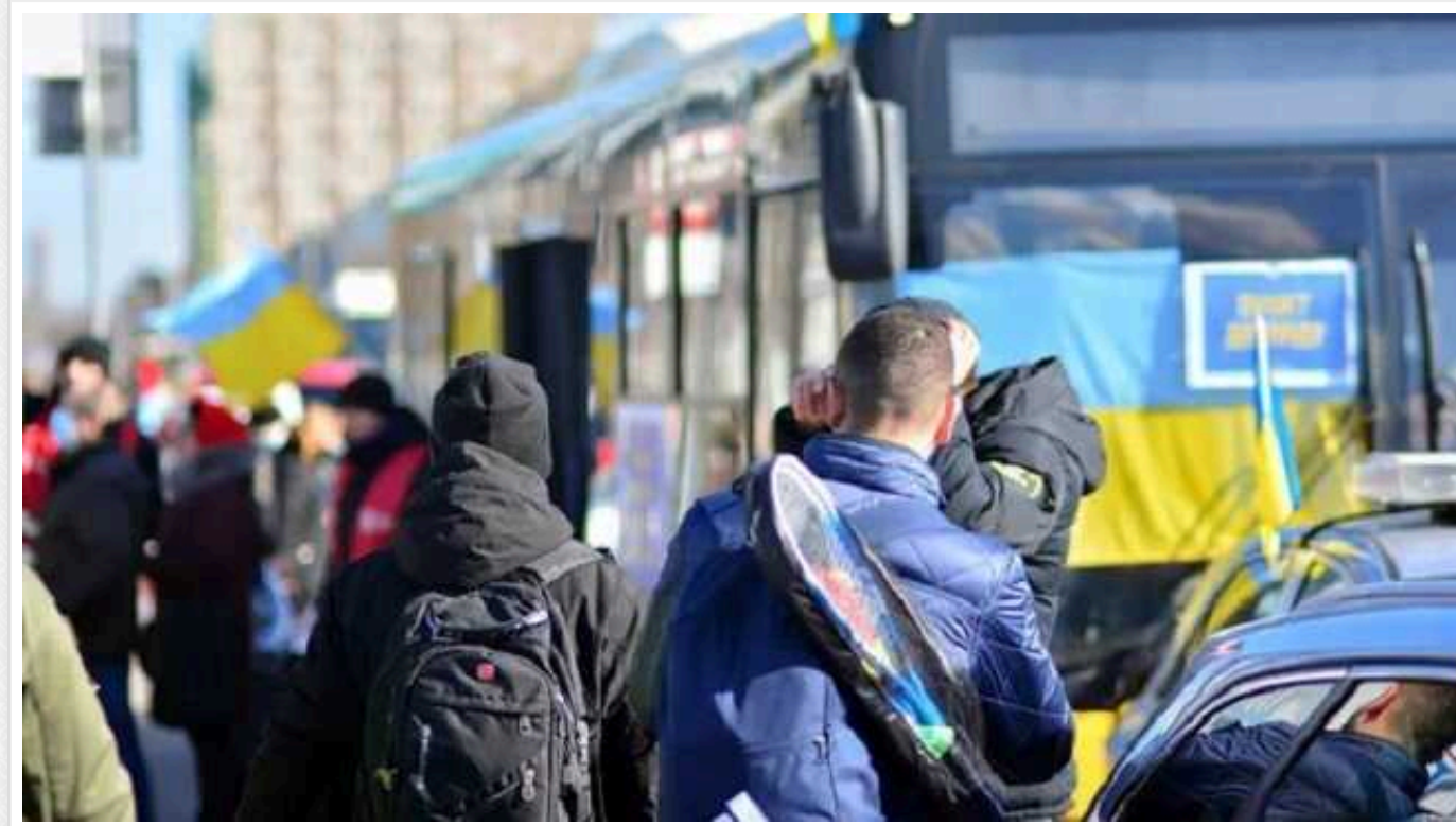
У Європі статус тимчасового захисту отримали понад 4 мільйони українців, - Євростат

Станом на 31 грудня 2023 року 4,31 мільйона українців, які виїхали внаслідок російського вторгнення, мали статус тимчасового захисту в ЄС.