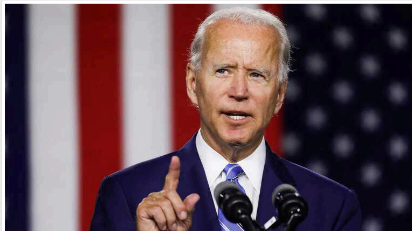
"Шанси на повернення Байдена до Білого дому в кращому разі невеликі", - Newsweek

Видання Newsweek з посиланням на аналітиків повідомляє, що шанси Байдена переобратися на другий термін невеликі.