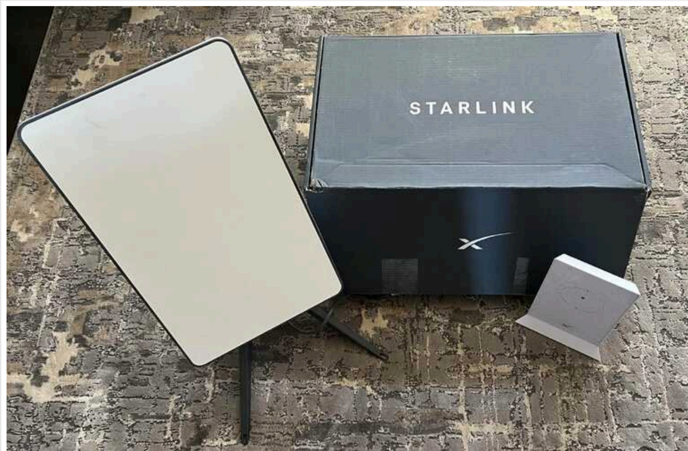
Військовий аналітик Жданов розповів, як РФ отримала Starlink і про наслідки для України

Росіяни отримали доступ до супутникового зв'язку Starlink через ОАЕ. В цьому не має сумнівів військовий аналітик Олег Жданов. В інтерв'ю "Телеграфу" він заявив, що це несе ризики погіршення ситуації на фронті.