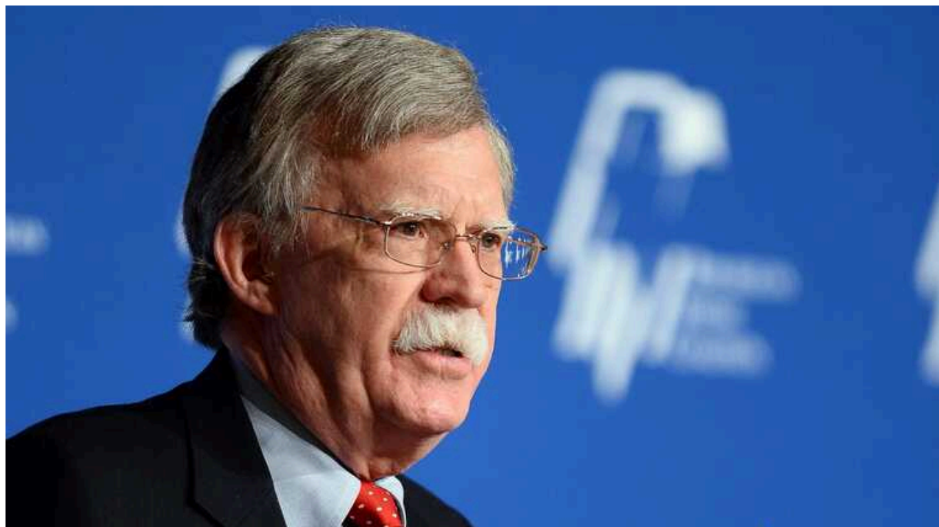
Погрози Трампа щодо виходу з НАТО слід сприймати серйозно, – експерт Трампа Джон Болтон

Погрози експрезидента США Дональда Трампа вийти з НАТО у разі повернення до влади слід сприймати серйозно, вважає колишній радник з нацбезпеки США в адміністрації Трампа Джон Болтон.