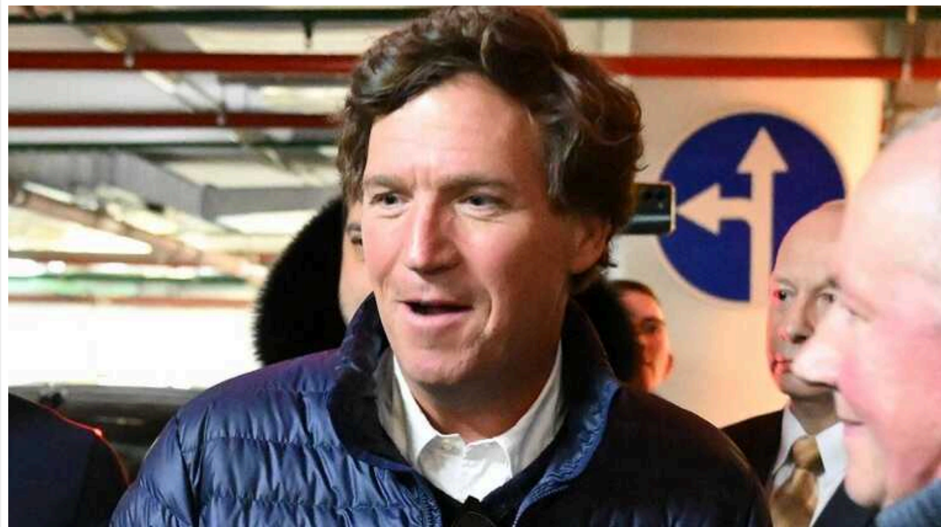
Пропагандисти запустили в мережі кампанію з відбілювання Карлсона: "Найбагатший ведучий і зразковий сім'янин"

Кремлівські пропагандисти розпочали активну кампанію з відбілювання репутації одіозного американського журналіста Такера Карлсона, який брав інтерв'ю у диктатора Володимира Путіна. Росіяни намагаються довести, що ведучий нібито не брав грошей за компліментарну бесіду з головним воєнним злочинцем РФ.