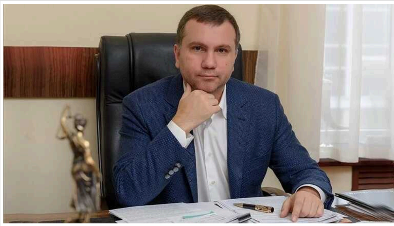
ВККС визнав суддю Вовка нездатним працювати у Верховному суді

12 лютого Вища кваліфікаційна комісія суддів ухвалила рішення, згідно із яким суддя Павло Вовк не може здійснювати правосуддя у Касаційному адміністративному суді у складі Верховного Суду. Скандальний суддя досі перебував кандидатом на посаду в КАС.