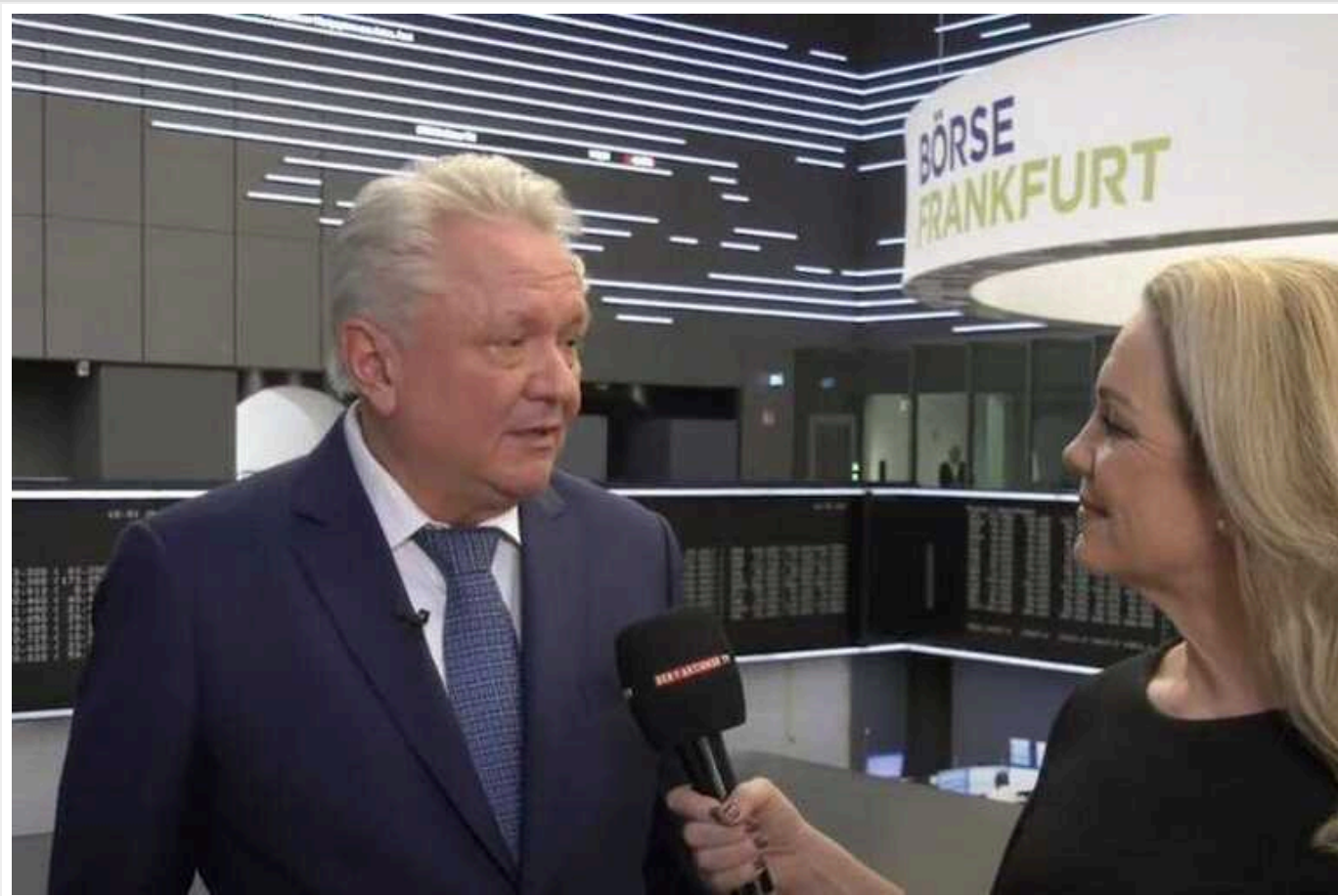
Потреби України в снарядах утричі перевершують можливості виробництва Німеччини, - глава Rheinmetall Армін Паппергер

Глава Rheinmetall Армін Паппергер заявив, що потреби України в снарядах утричі перевершують можливості виробництва Німеччини.