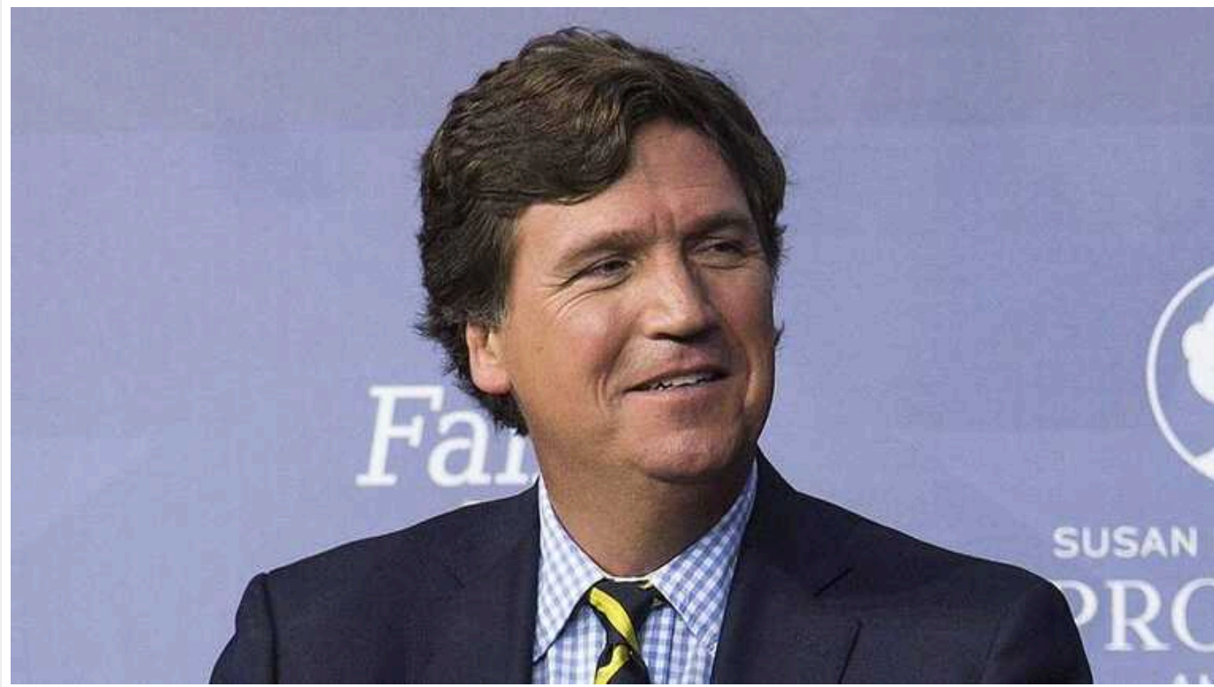
Путін "готовий піти на серйозний компроміс щодо України", - Такер Карлсон

Трампліст Такер Карлсон повідомляє, що Путін "готовий піти на серйозний компроміс щодо України".