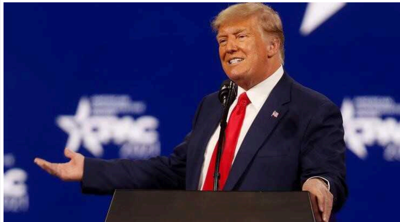
Допомога Україні на 60 мільярдів доларів: республіканці злякалися "пастки" для Трампа

Законопроект із допомогою Україні на 60 млрд доларів, який розглядають у Сенаті США, передбачає підтримку до вересня 2025 року. Це може стати "пасткою" для колишнього президента Дональда Трампа у разі його переобрання.