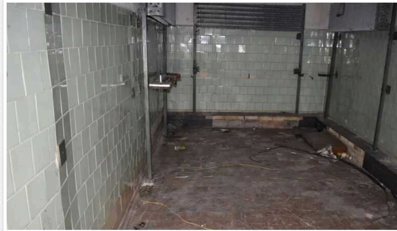
Російському окупанту повідомили про підозру: причетний до катівень у морозильних камерах аеропорту Гостомеля

Правоохоронці повідомили про підозру офіцеру Росгвардії у порушенні законів і звичаїв війни. Зловмисник причетний до утримання та катування українців у морозильних камерах аеропорту Гостомеля Київської області.