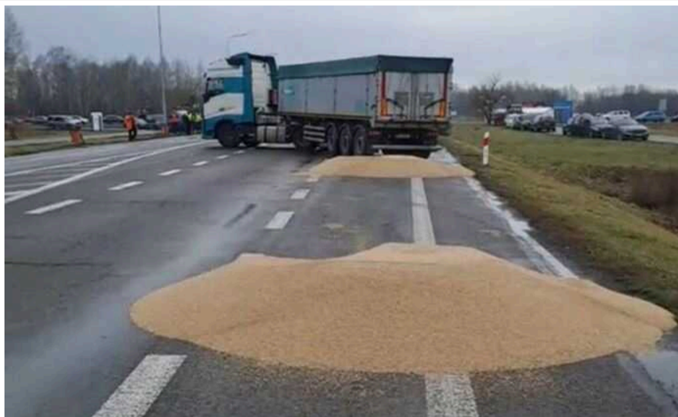
В Україні жорстко відреагували на псування зерна у Польщі: це вже не мирний протест, винні мають відповідати

Умисне знищення українського зерна польськими протестувальниками на українсько-польському кордоні не має нічого спільного з мирними протестами як з юридичного, так і морального погляду, а псування українського зерна – неприпустиме. Після того, що сталося, поліція Польщі зокрема і влада країни загалом має вирішити проблему, адже тепер йдеться про конкретні майнові питання.