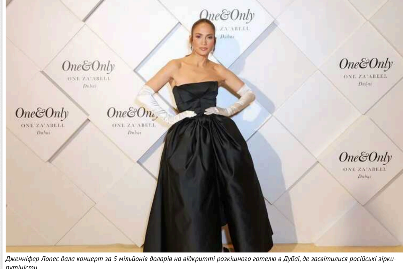
Дженніфер Лопес. Фото кінешоті за 5 мільйонів доларів на відкритті розкішного готелю в Дубаї, де засвітилися російські зірки-путністи

Всесвітньо відома американська співачка та акторка Дженніфер Лопес стала однією з головних зірок на відкритті елітного готелю в Дубаї, ОАЕ, під назвою One & Only One Za'abeel. 54-річна артистка спочатку прийшла червоною доріжкою в розкішній сукні, а потім вийшла на сцену, аби розважити гостей події своїми хітами. Побійються, що за цей виступ знаменитості заплатили 5 мільйонів доларів (понад 188 млн гривень).