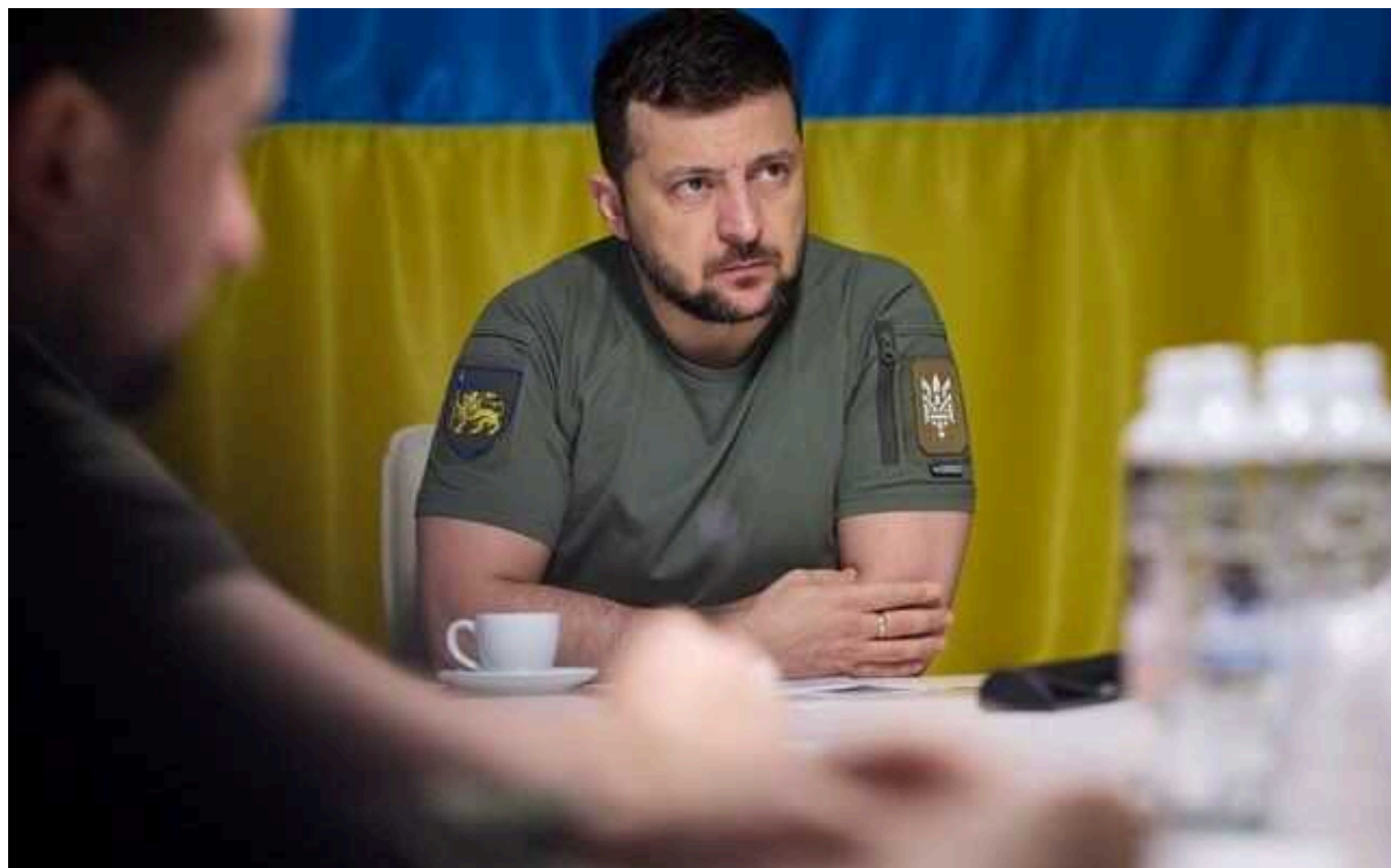
Зеленський провів першу Ставку в оновленому складі: доповідав Сирський і не лише

Президент Володимир Зеленський сьогодні, 12 лютого, провів засідання Ставки верховного головнокомандувача в оновленому складі. Серед іншого обговорювалося питання фронту та забезпечення армії снарядами.