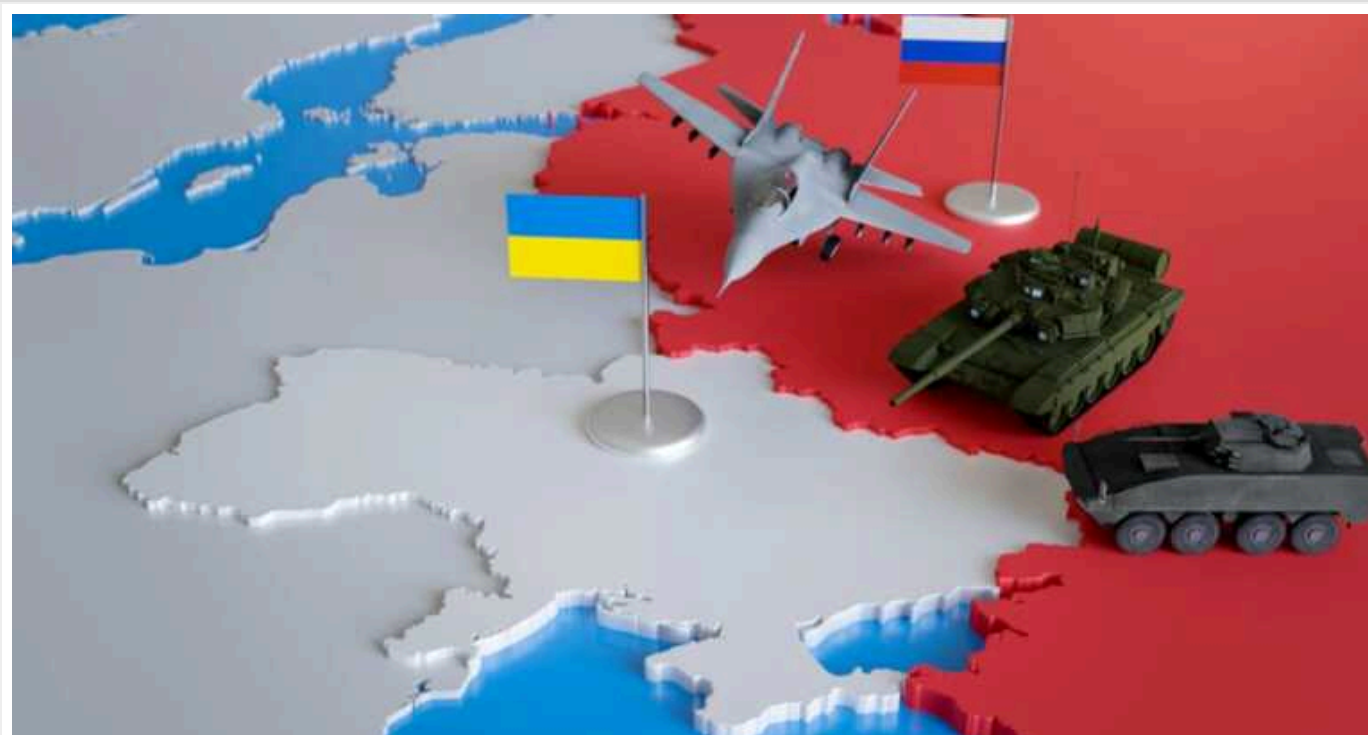
РФ за рік стала сильнішою і має перевагу у війні, - голова норвезької розвідки

Очільник Служби розвідки при Міністерстві оборони Норвегії віцеадмірал Нільс Андреас Стенсенс заявив, що за останній рік Росія помітно посилила позиції та досягла успіху у веденні бойових дій проти України попри міжнародні санкції.