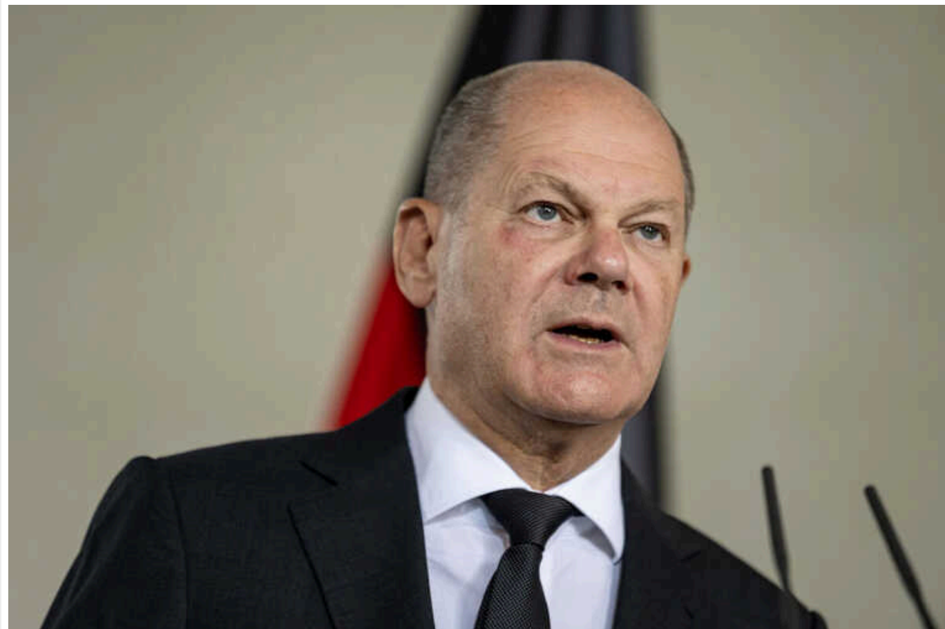
Шольц закликав партнерів збільшити виробництво зброї в Європі

Канцлер Німеччини Олаф Шольц закликав європейських партнерів значно збільшити виробництво зброї.