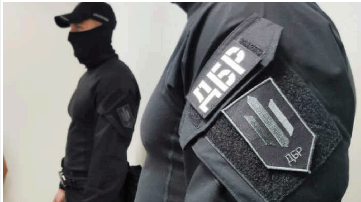
Колишньому поліцейському, який навів ракету окупантів на селище Гроза, оголосили нову підозру

Колишньому поліцейському, який разом із братом наводив ракету на селище Гроза у Харківській області, оголосили нову підозру.