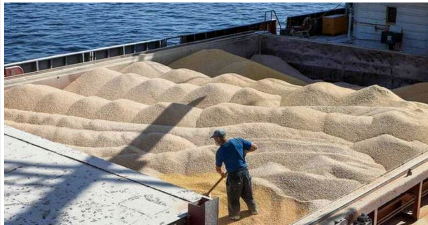
Учасника «зернового коридору» викрили в ухиленні від сплати податку на 19,6 мільйона гривень

На Одещині учасника «зернового коридору» викрили в ухиленні від сплати 19,6 млн гривень при експорті насіння соняшнику