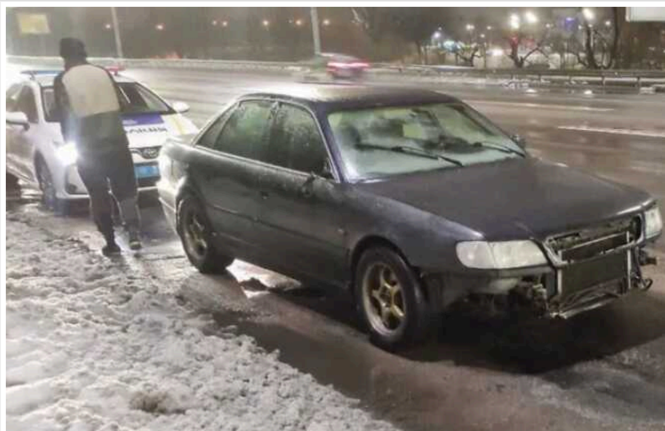
У Києві зупинили водія, який п'яним катався без водійського посвідчення на машині зі знищеним VIN-номером

У Голосіївському районі Києва зупинили водія Audi, який порушував ПДР. Як виявилось, у чоловіка були явні ознаки алкогольного сп'яніння, він позбавлений прав керування, а у машини знищено VIN-номер.