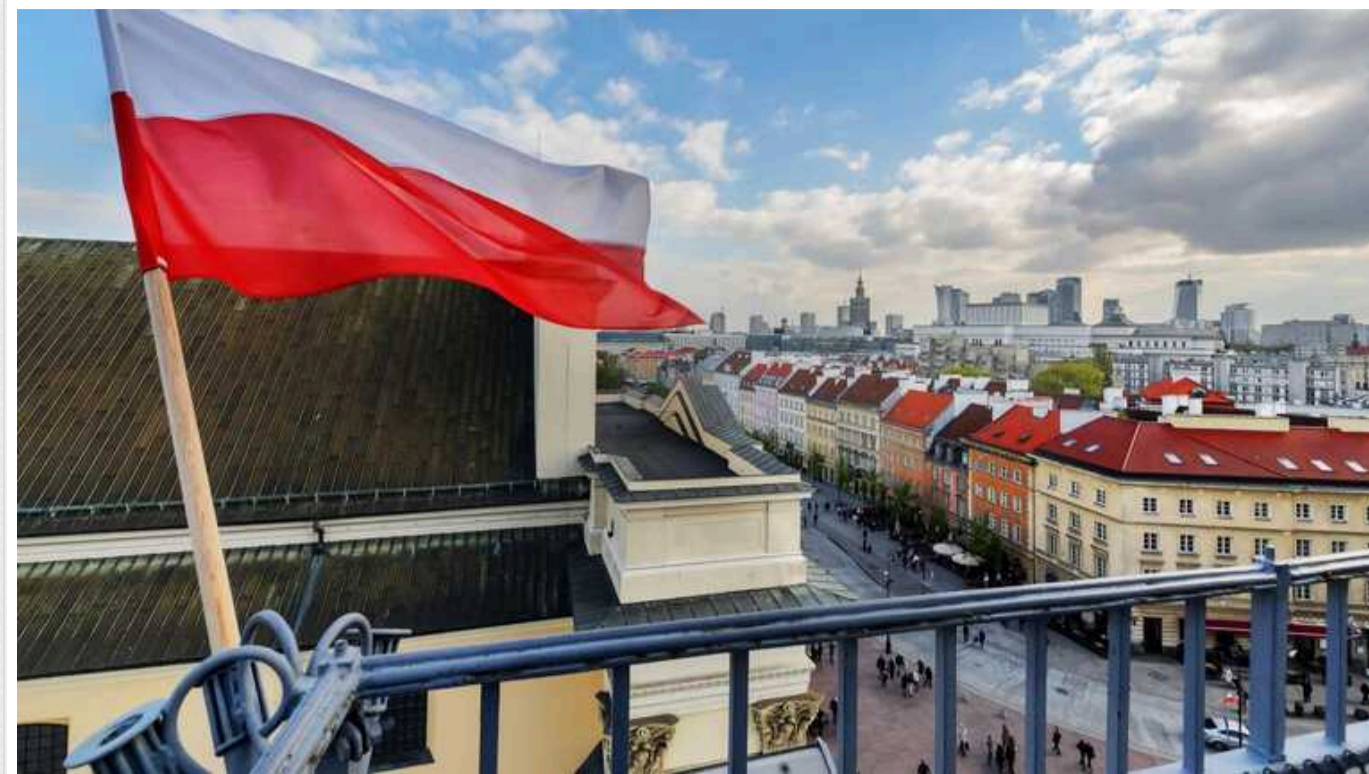
Через кілька років Польща може отримати ядерну зброю в рамках програми NATO Nuclear sharing