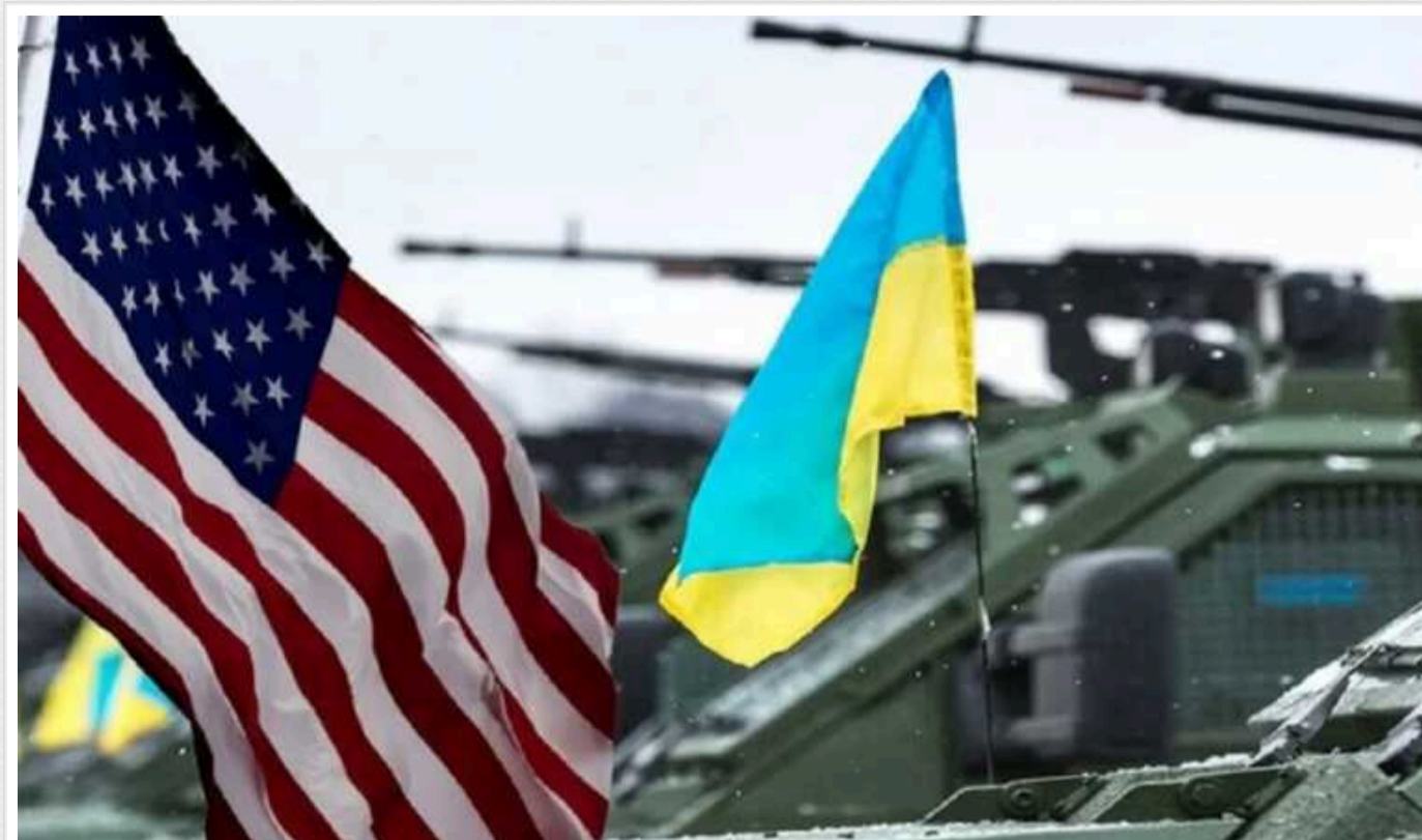
Аналітики Rand: США повинні сприяти якнайшвидшому закінченню війни в Україні для стримування Росії

Американська аналітична корпорація Rand рекомендує владі США сприяти якнайшвидшому завершенню війни в Україні та стійкому припиненню вогню. Інакше Україна може втратити ще більше територій, а ризик прямої війни РФ та НАТО зростає.