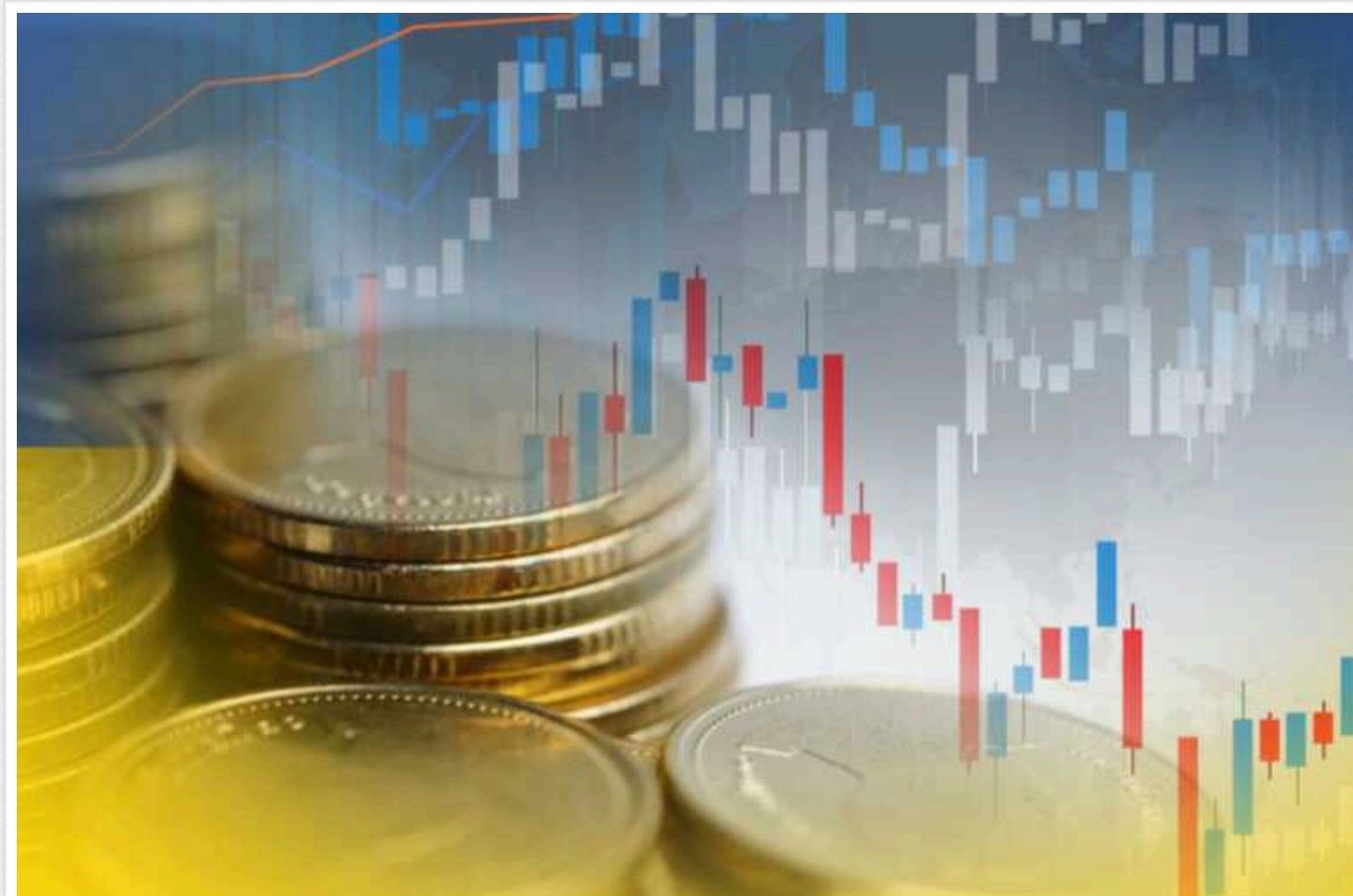
У січні інфляція сповільнилася до 0,4%

Зростання споживчих цін в Україні у січні 2024 року сповільнилося до 0,4%, порівняно з 0,7% у грудні 2023 року.