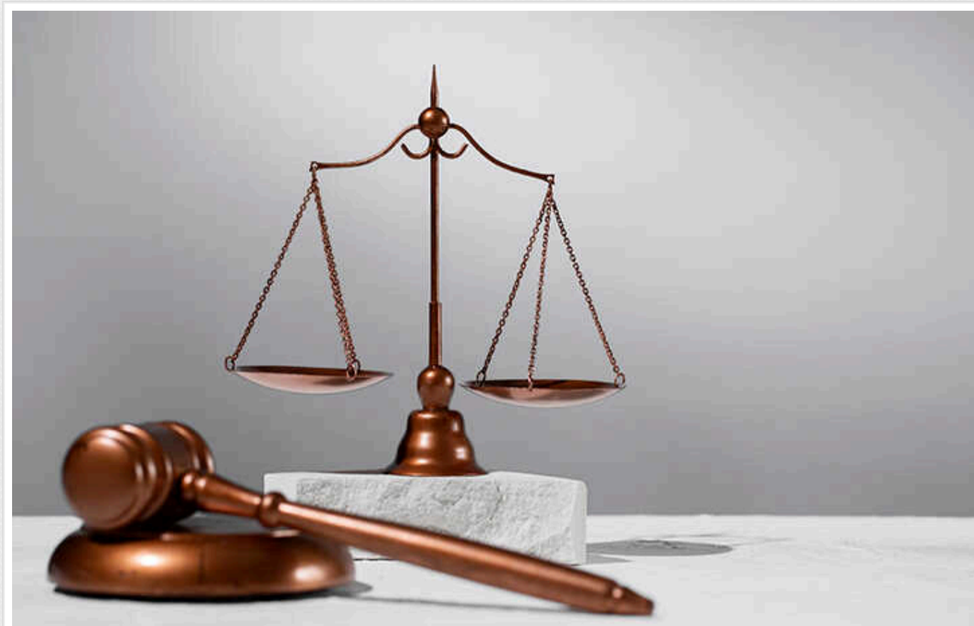
У столиці судитимуть водія тролейбуса, який травмував пасажирку: затиснув руку дверима та протягнув кілька метрів

У Києві судитимуть водія тролейбуса, який травмував пасажирку. Він проїхав декілька метрів від зупинки, затиснувши в дверях руку 76-річної пасажирки, яка внаслідок цього зламала ногу.