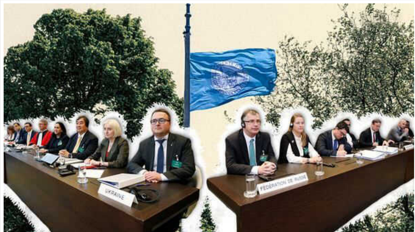
Чи виправдана стратегія України в Міжнародному суді ООН, і які уроки маємо винести?

31 січня 2024 року Міжнародний суд ООН (далі – МС ООН) виніс рішення по справі України проти РФ. Це перша заява, яка охоплювала події збройного конфлікту з 2014 року.