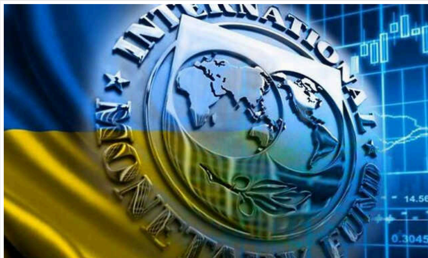
До Києва прибула делегація представників місії МВФ

До Києва прибули представники місії МВФ. Мета візиту – обговорення економічної політики влади України та виклики, що стоять перед економікою. Також команда братиме 13 лютого участь в інаугураційному засіданні керівного комітету Фонду розвитку потенціалу України.