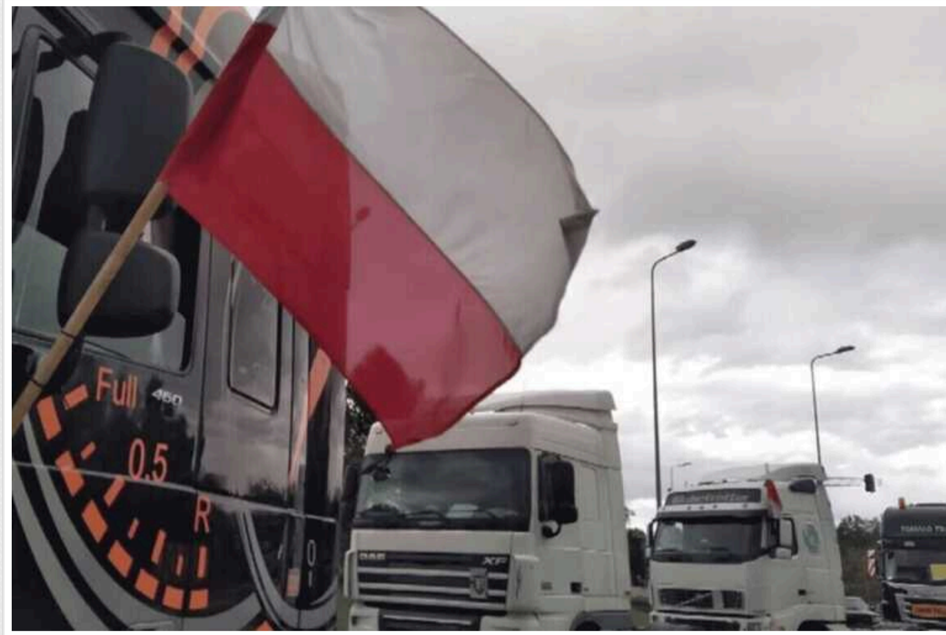
Польські фермери посилили блокаду кордону України: перекрито нові пункти пропуску

Польські фермери розширили масштаб блокування українського кордону. Так, 12 лютого о 10:10 розпочалися акції протесту неподалік пункту пропуску Зосін. Також було заблоковано рух біля пункту пропуску Долгобичува. Крім того, відновлено блокування у напрямку пунктів пропуску Медика – Шегіні.