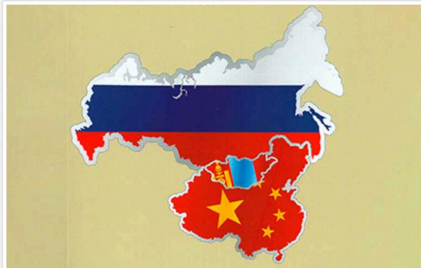
Після "історичного екскурсу" Путіна в інтерв'ю Карлсону, яким він пояснював мотиви вторгнення в Україну, китайці та монголи почали виступати зі своїми "екскурсами"

Так, колишній президент Монголії Цахіягійн Елбегдорж опублікував карту Монгольської імперії 13 століття, до складу якої входила значна частина нинішніх територій Китаю та Росії, вся Середня Азія та Іран.