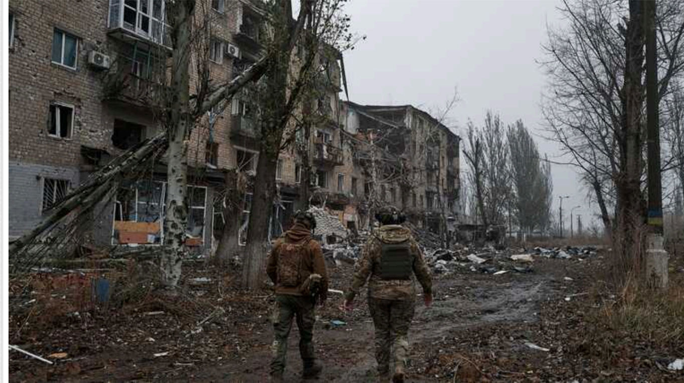
Окупанти вже не проводять «м'ясні штурми» в Авдіївці, а працюють малими штурмовими групами за підтримки з неба