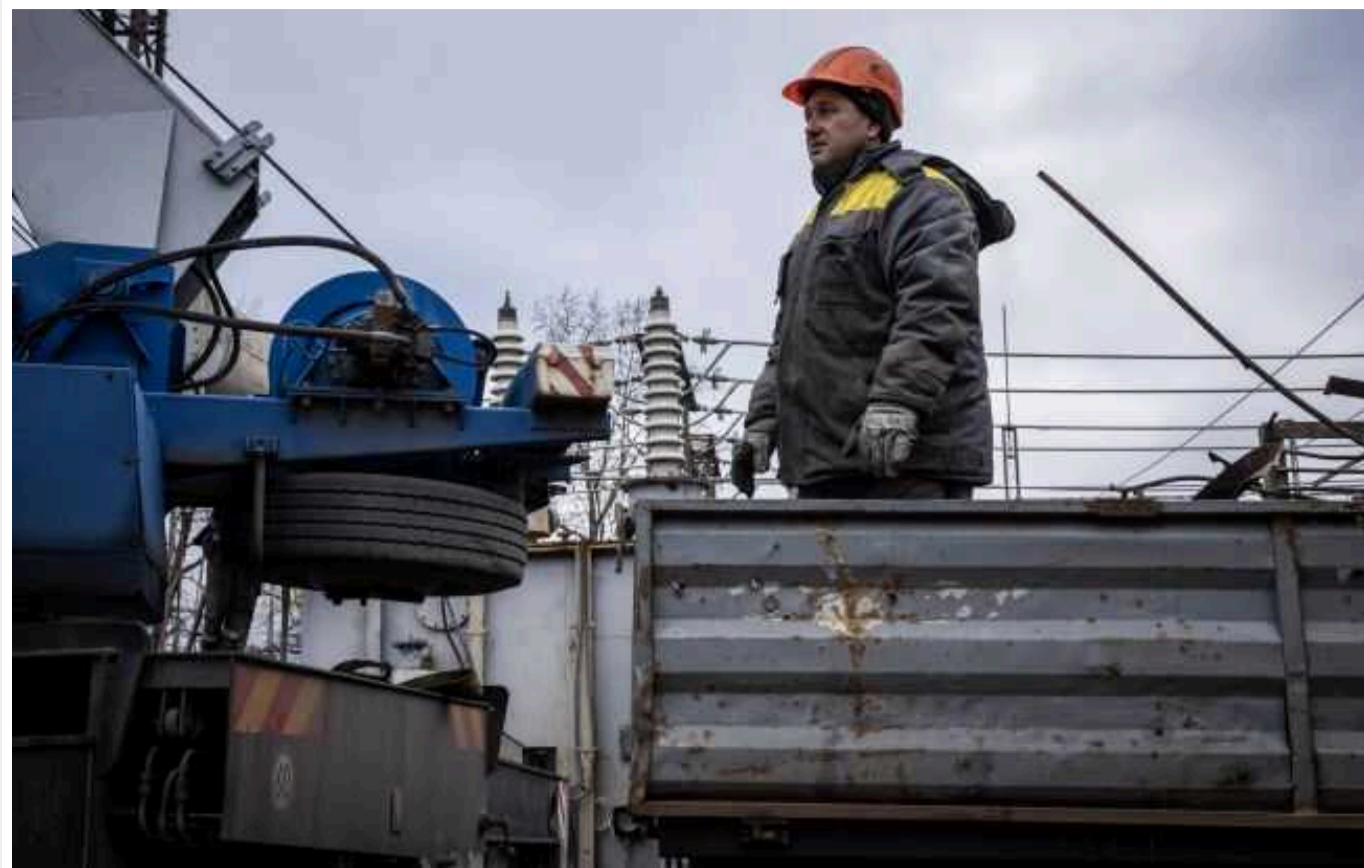
У Міненерго повідомили про наслідки атаки російських дронів на Павлоград

Уночі внаслідок ворожої дронавої атаки відключилась підстанція 330 кВ НЕК "Укренерго" в м. Павлоград Дніпропетровської області. Сталася пожежа, пошкоджено енергетичне обладнання.