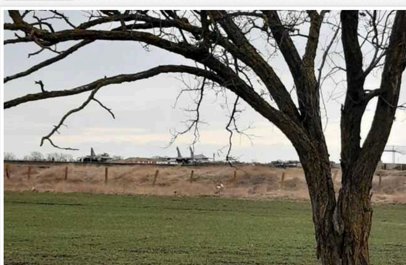
Партизани розвідали аеродром у Ёйську, який Росія використовує для ударів по Україні

Партизани провели розвідку у місті Ёйськ (Краснодарський край, Росія). Зокрема, вони пробралися на аеродром, який використовує РФ для ударів по Україні.